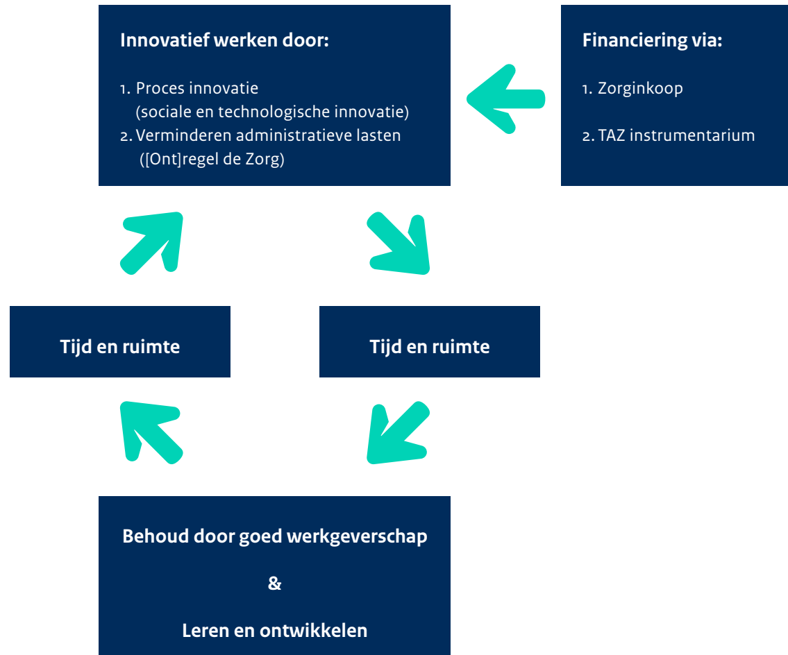
Figuur iteratief proces anders werken