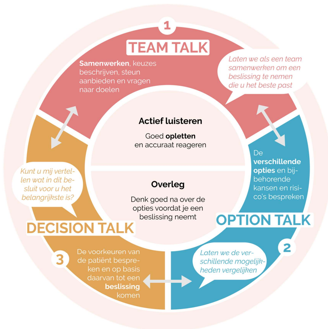
Fig 1. Three-Talk model of shared decision making.

In navolging van het model van Elwyn (2012) is een analyse van verschillende internationaal gebruikte middelen gemaakt en daar is het vierstappenmodel uit voortgekomen (Stiggelbout, 2015). Kort daarna is op basis van internationale consensus een model van drie talks gepubliceerd (Elwyn, 2017).