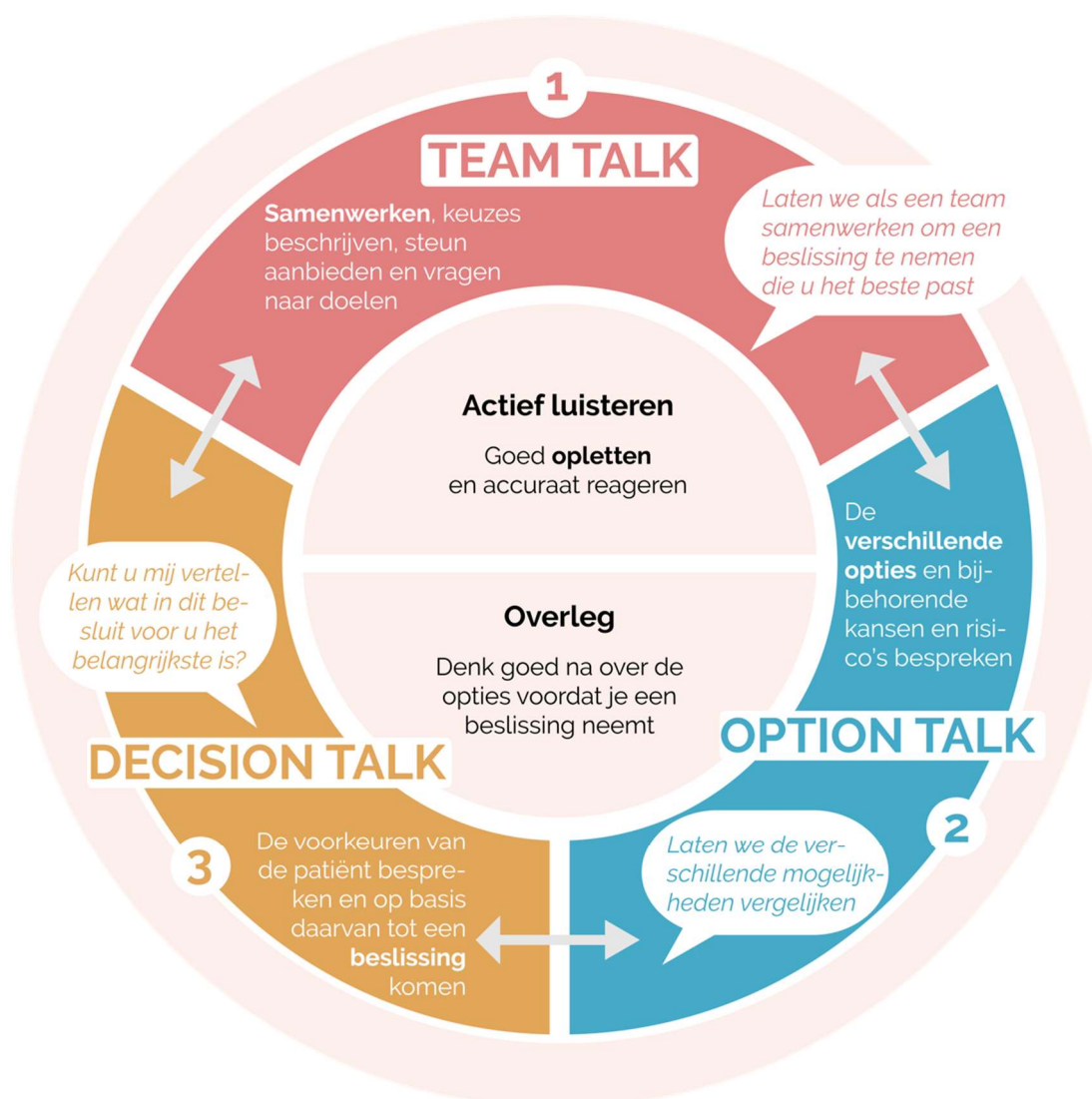
Fig. 2. Gespreksmodel Samen Beslissen

Er zijn meerdere modellen voor Samen Beslissen. Veel modellen komen voort uit een ander model en sommige zijn toegespitst op bepaalde doelgroepen, in de bijlage wordt dit nader uitgewerkt (Bijlage 2). In een model voor Samen Beslissen zijn de stappen weergegeven die de zorgverlener met de patiënt doorloopt om samen tot een besluit te komen. De meeste van de huidige modellen die in Nederland gebruikt worden, zijn gebaseerd op het driestappenmodel van Elwyn uit 2012 (herzien in 2017) (6). Vanuit het programma Uitkomstgerichte Zorg is het advies het vier stappen model als basis te gebruiken, zie de toelichting in bijlage 2. Voor patiënten met chronische aandoeningen benadrukt Elwyn nog extra het belang van het bespreken van doelen; dit noemt hij 'Doelgericht Samen Beslissen' (13). Het gespreksmodel voor Samen Beslissen is weergegeven in Figuur 1 en in de tekst eronder worden de drie stappen nader toegelicht.