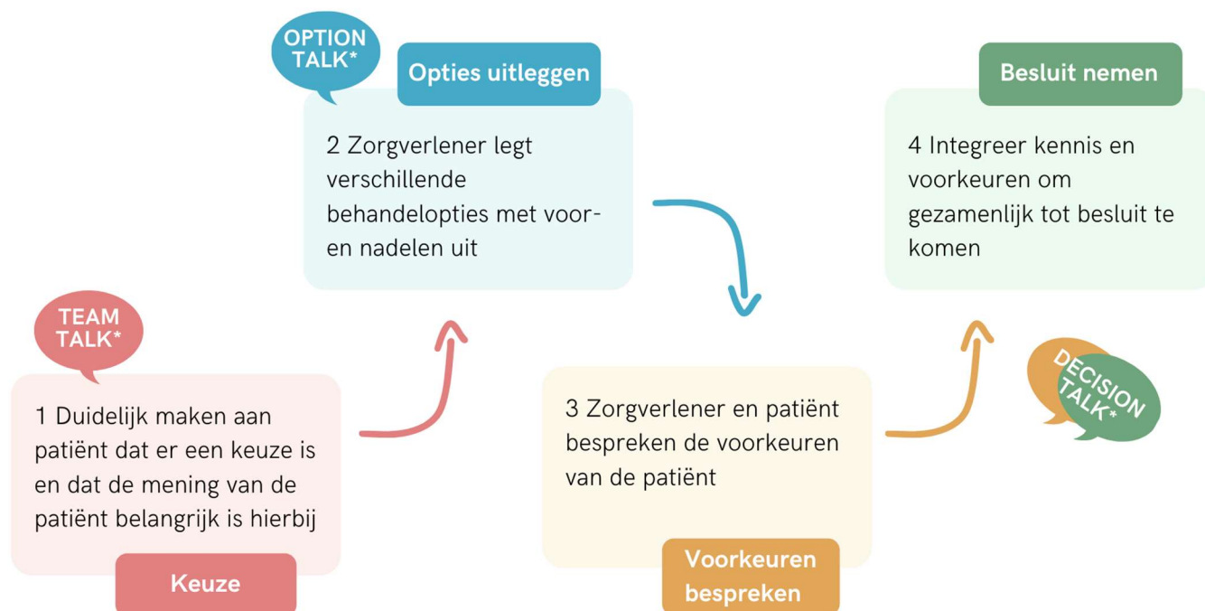
Fig. 3 Vierstappen model.

In onderstaande figuur is worden de vier stappen uitgebeeld in relatie tot de talks.